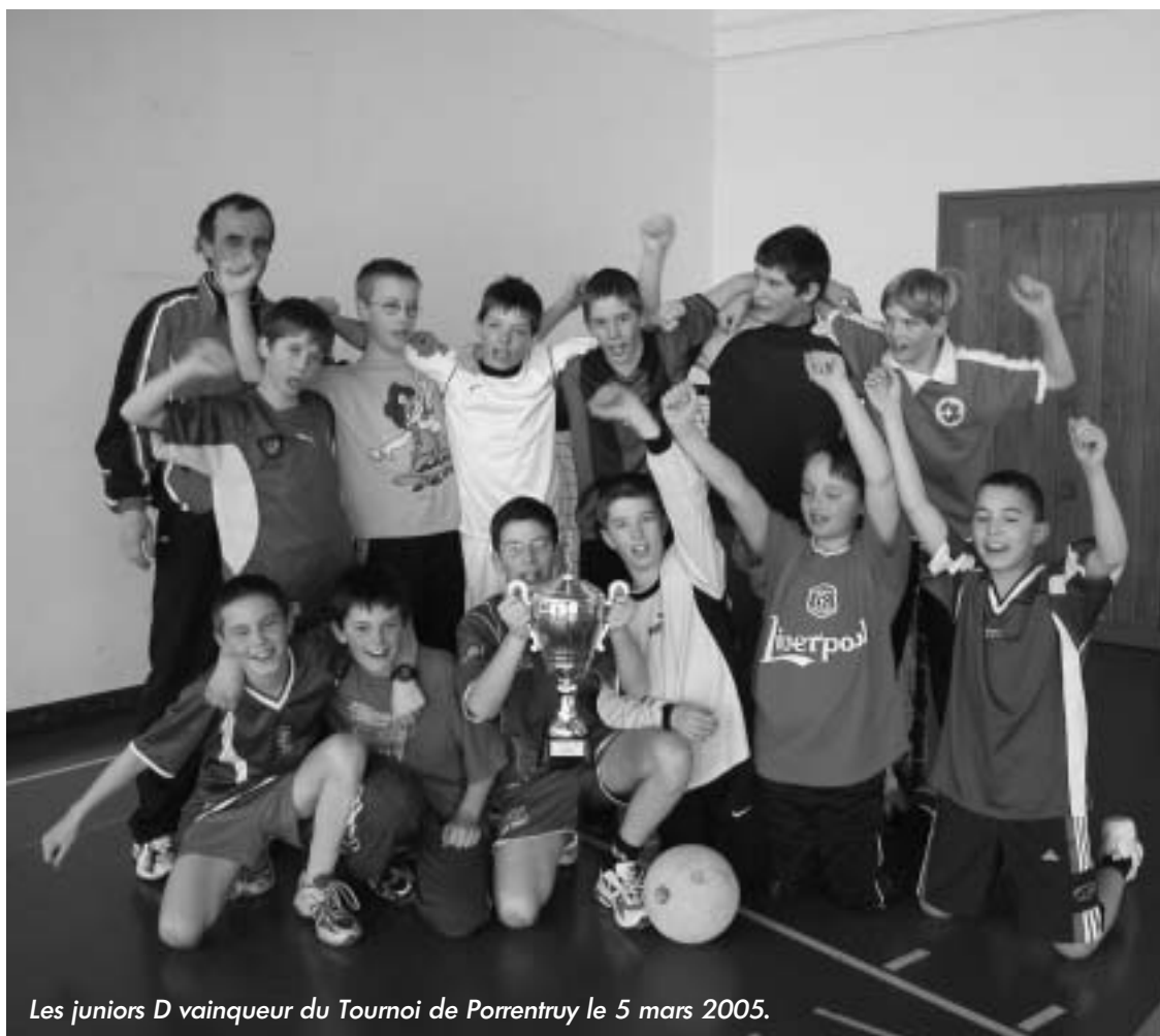
Les juniors D vainqueur du Tournoi de Porrentruy le 5 mars 2005.