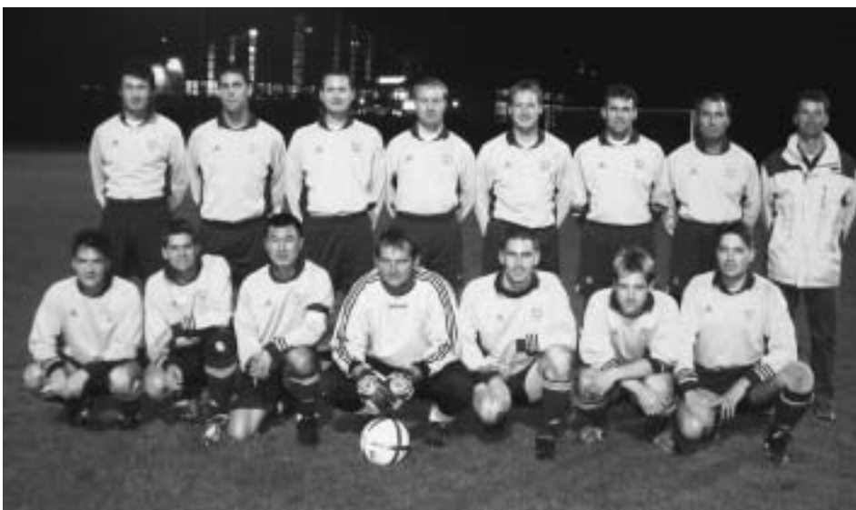
La troisième du FCFM prête pour le championnat de 4 e ligue

Pour connaître les lieux et les heures des matches, veuillez consulter Le Franc-Montagnard chaque jeudi.